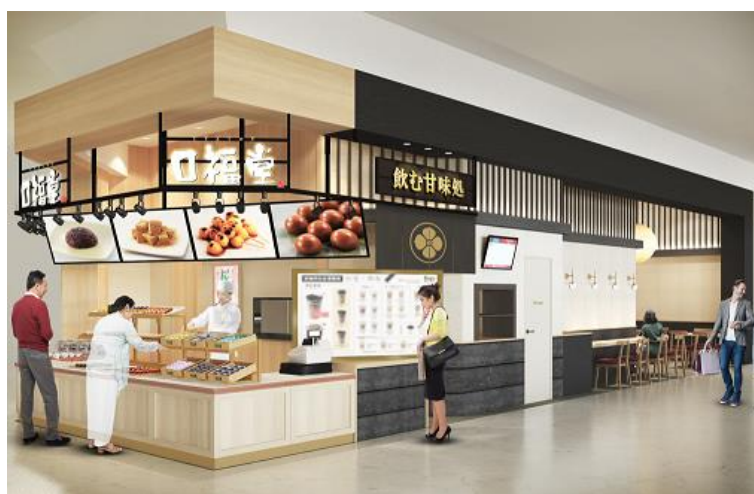
柿安 口福堂 イオンモール新居浜店 店頭イメージ

明治4年(1871年)牛鍋店として創業以来、150余年の歴史を誇る肉の老舗、株式会社柿安本店(本社:三重県桑名市/代表取締役社長:赤塚保正、以下:柿安)が展開する和菓子ブランド「口福堂」は、2023年6月23日(金)にイオンモール新居浜店をリニューアルオープンいたします。同店舗を含めると、四国エリアで5店舗、全国で計172店舗となります。(2023年6月21日現在)。