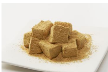
『料亭わらび餅』 (税込 604 円/1 パック<大>)