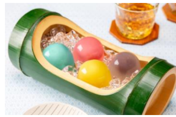
『水まんじゅう』 (税込 194 円/1 個)