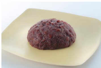
『おはぎ (つぶ)』 (税込 140 円/1 個)

看板商品として不動の人気を誇る『おはぎ (つぶ)』や、「料亭 柿安」でもお出ししている『料亭わらび餅』は、長く愛されている「口福堂」の代表的な商品です。さらに季節ごとに期間限定商品が店頭を彩り、これからの時期にぴったりな『水まんじゅう』も販売いたします。