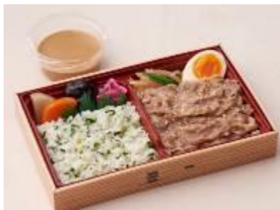
『黒毛和牛 だししゃぶ弁当 胡麻だれ付』 税込 1,080/1個