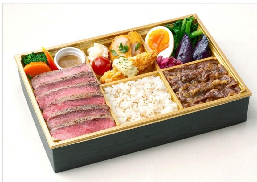
NEWoMan 新宿 柿安 牛めし限定商品 『柿安 黒毛和牛味わい弁当』税込3,801円／1個

オーダーを受けてから焼き上げるステーキが入った贅沢なお弁当や、朝食用おにぎり“牛肉しぐれ巻”など、これまでにない5つの新商品を含む20種類以上の商品を取り揃えました。さらに、朝、昼、夜とそれぞれのシーンに合せた商品展開で、働く女性から駅を利用する観光客まで、幅広いお客様にこだわりのお弁当を提供します。