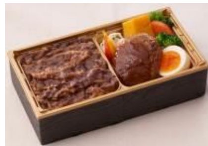
『黒毛和牛 牛めし&ハンバーグ弁当』 税込 1,451/1個