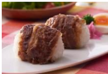
『牛肉しぐれ巻セット』 税込 391 円/1セット

巨大ターミナル新宿駅構内に出店することから、お客様の多様なニーズに合わせて商品を開発。「柿安 牛めし」初となる朝食用おにぎり「牛肉しぐれ巻セット」や女性をメインターゲットにした、お肉をさっぱり味わえる「黒毛和牛 だししゃぶ弁当 胡麻だれ付」、さらに「黒毛和牛 牛めし」とデミグラスソースとの相性抜群の黒毛和牛入りハンバーグが入ったボリューム満点の「黒毛和牛 牛めし&ハンバーグ弁当」など、多彩なラインナップを提供します。