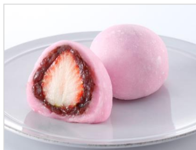
（粒あん・いちご1粒入り） <税込価格 248 円> 【一部店舗先行発売】 12月1日（木）～