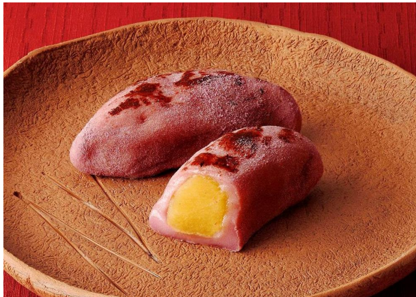
『焼きいも大福』（税込価格 151円）