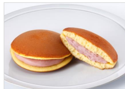
<税込価格 172 円> 【発売日】 11月10日（木）～好評発売中