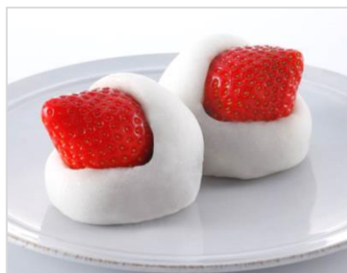
（こしあん・いちご外出し） <税込価格 248 円> 【一部店舗先行発売】 12月1日（木）～