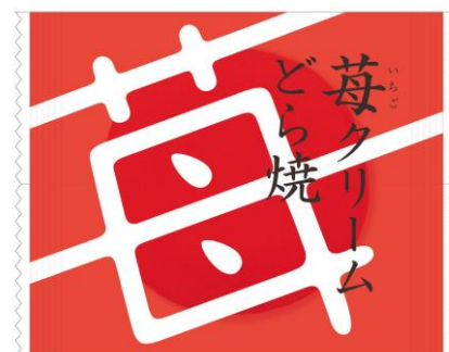
「苺」の文字を可愛らしくデザインしたパッケージにリニューアル