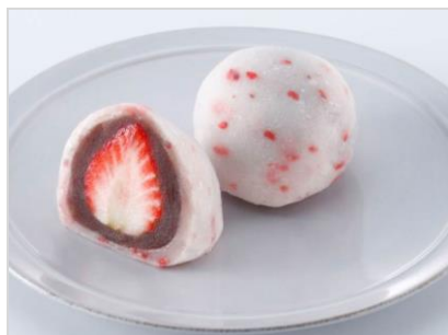
（こしあん・いちご1粒入り 水玉タイプ） <税込価格 248 円> 【発売日】 11月10日（木）～好評発売中