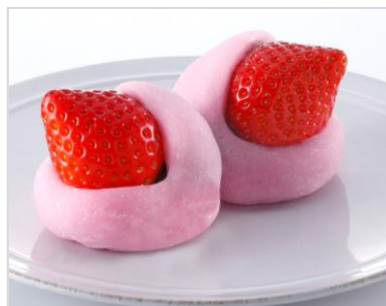
（粒あん・いちご外出し） <税込価格 248 円> 【発売日】 11月10日（木）～好評発売中